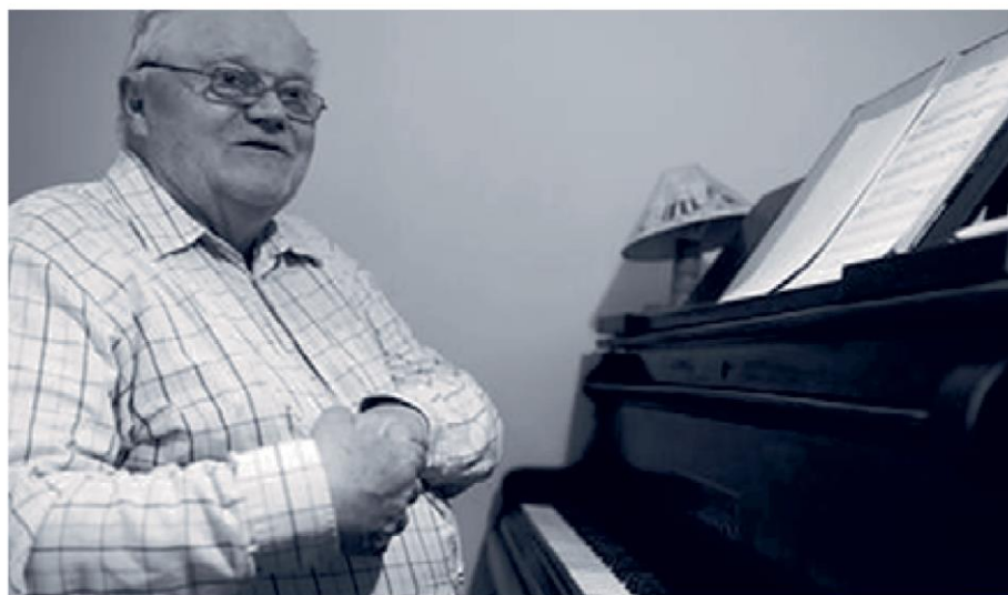
Václav Hálek v roce 2011.